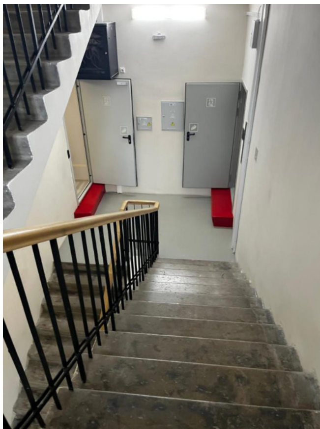
Фото. 1. Лестница ЛКЗ. Вид на 3-ий этаж