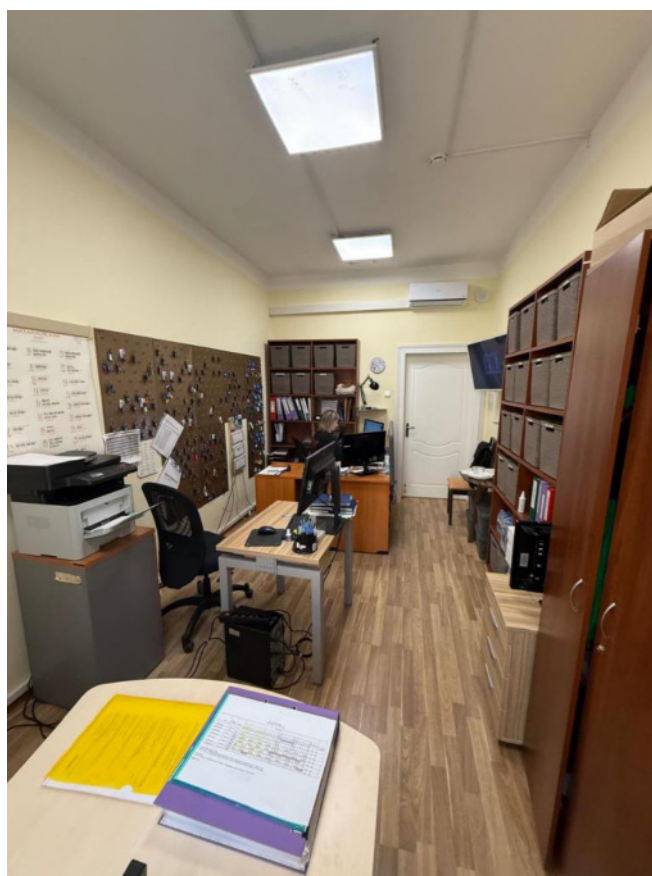
Фото. 4. Третий этаж. Офисное помещение (пом. № 3).