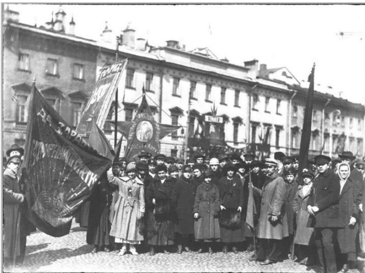
Рис. 3. Демонстранты на площади Лассаля (бывш. Михайловская). Период создания: 1 мая 1919 г.