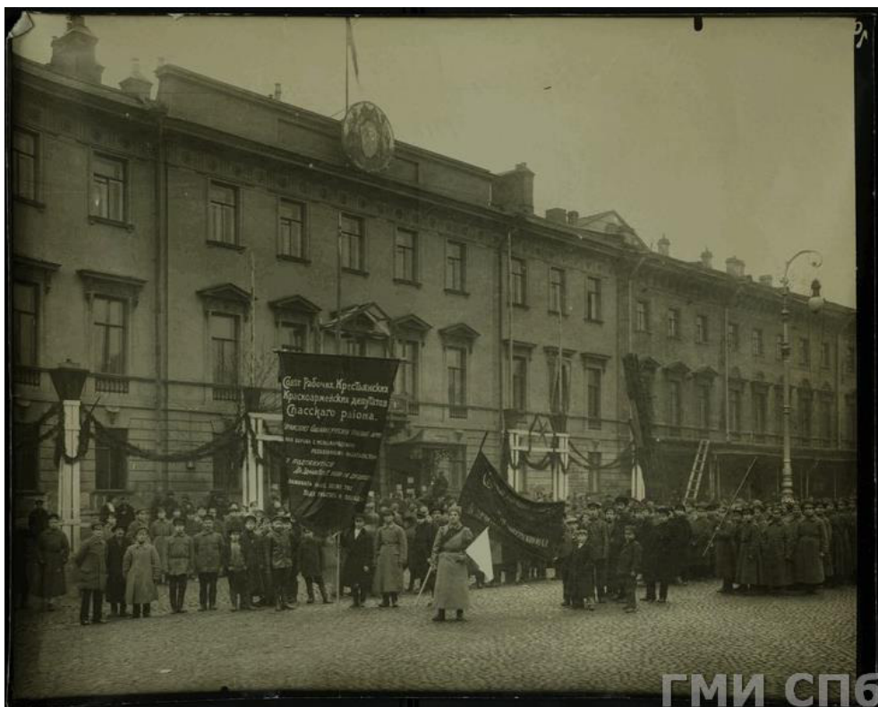
Рис. 2. Празднование I годовщины Октябрьской революции в Петрограде. Построение колонны демонстрантов Спасского района у дома № 3 на Михайловской площади. Период создания: 1918 г. (Эл. источник: государственный каталог музейного фонда РФ. Номер в Госкаталоге: 62761845. Номер по КП (ГИК): ГМИ СПб 152789. Инвентарный номер: