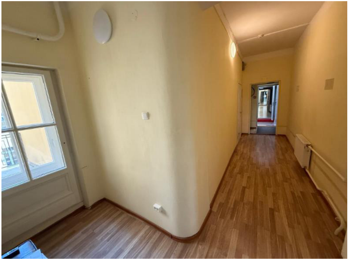
Фото. 5. Третий этаж. Офисное помещение (пом. № 2).