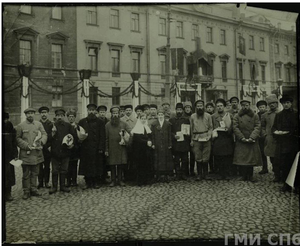
Рис. 1. Группа рабочих на празднование годовщины Октябрьской революции на фоне главного фасада здания по адресу пл. Искусств, д.3 . Период создания: 1918 г. (Эл. источник: государственный каталог музейного фонда РФ. Номер в Госкаталоге: 62762227. Номер по КП (ГИК): ГМИ СПб 153040. Инвентарный номер: ГМИ СПб Инв.№-П-Б-5808 ф. Местонахождение: СПб ГБУК «Государственный музей истории Санкт-Петербурга»)